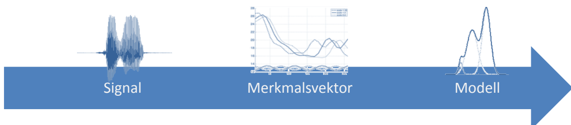
Bild 1: Der Mustererkennungsprozess (Trainings-Phase) zur Audioklassifikation.